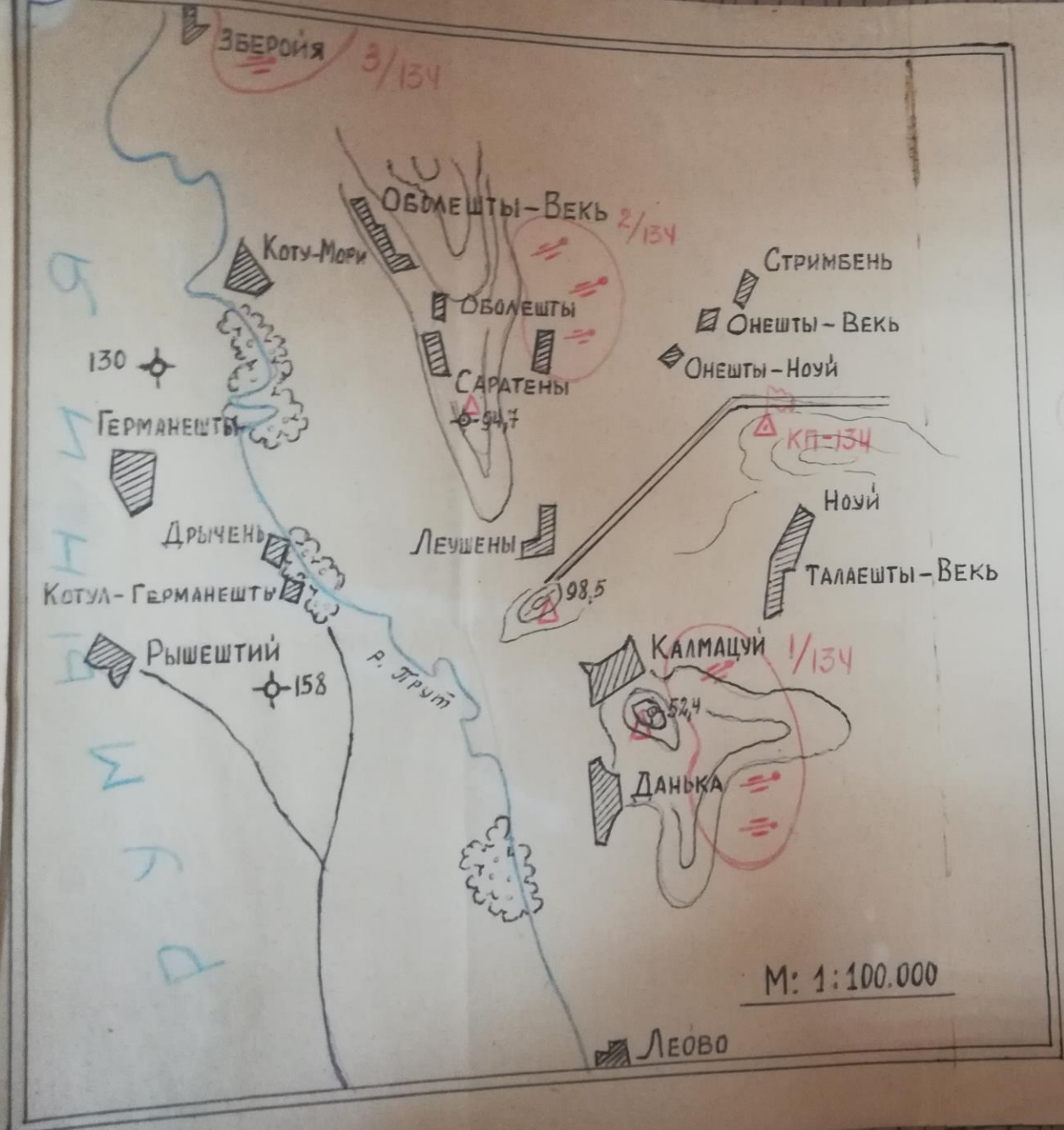
СХЕМА БОЕВОГО ПОРЯДКА 134 ГАП В ОБОРОНЕ НА 28 ИЮНЯ 1941 г.