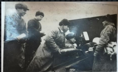
Первая батарея 134 ГАП ведёт огонь по противнику. 1942 г.